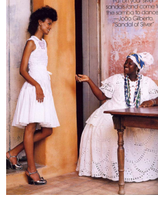
Fig. 7. Vogue USA, 2006, Mar., p.530.