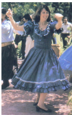
Fig. 9. Kim, 1992, p.198.

라틴의 낭만적 스타일은 스페인의 영향을 받은 여성적이고 낭만적인 형태의 세련된 룩으로 우아한 여성미를 표현한다.