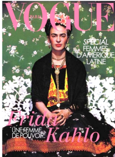
Fig. 1. Vogue Paris, 1938, Mar., Front page.