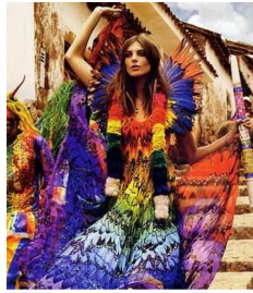
Fig. 6. Vogue UK, 2009, Mar., p.438.