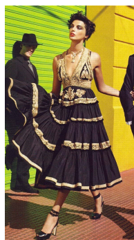
Fig. 10. Vogue USA, 2006, Mar., p.186.