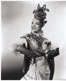
Fig. 5. Carmen Miranda, 1940s, http://users.polisci.wisc.edu