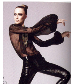
Fig. 11. Vogue USA, 2008, Sep., p.538.