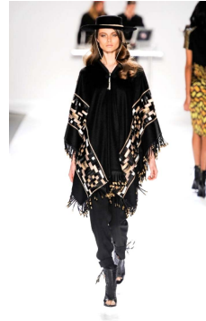
Fig. 3. Carlos Miele, 2012 F/W, http://www.samsungdesign.net