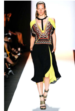
Fig. 4. BCBG, 2012 F/W, http://www.samsungdesign.net

활동하는 디자이너인 Carlos Miele의 2012 F/W 컬렉션으로 구슬이 달린 프린지 디테일의 판초, 기하학적 패턴, 챙이 넓은 납작 모자로 라틴 아메리카의 민속적 느낌을 전달하면서도 검정색을 위주로 한 모노톤의 색상과 단순한 울 소재의 바지로 현대적인 감각을 표현하였다. Fig. 4의 대중적 브랜드인 BCBG의 2012 S/S 컬렉션에 나타난 튜닉형의 드레스로 멕시코의 전통적인 기하학적 문양을 앞판 전체에 사용하고, 검은색과 노란색의 강렬한 원색대비로 대담하지만 하늘거리는 소재의 사용과 어깨의 노출로 여성적인 느낌을 표현함으로써 민속적 느낌을 보다 대중적인 감각으로 표현한 것이다. 이상에서 인디오의 민속적 스타일은 타국의 문화적 호기심에서 시작되어 각박하고 발달된 현대사회의 메미름을 채워줄 수 있는 원시적 문명과 전통에 대한 회귀로 민속의상과 전통 문양의 모티브가 주요한 특징으로 나타나는 스타일임을 알 수 있다.