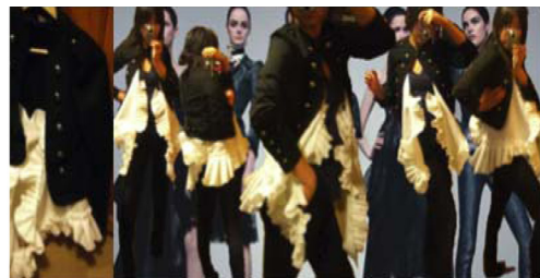
Image 6. Styling after makeover. www.stylebubble.co.uk .