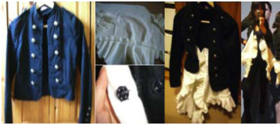
Image 5. Primark jacket makeover.