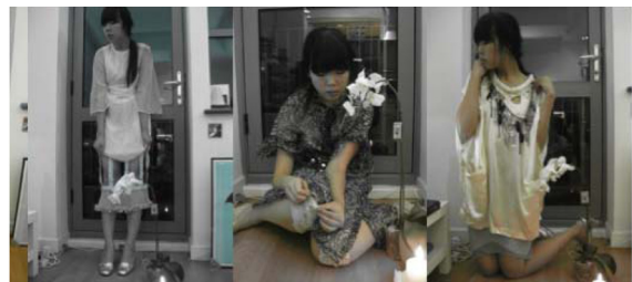
Image 12. Branched Out. www.stylebubble.co.uk .