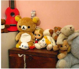
Image 1. Bancourt's dolls from childhood. www.thecherryblossomgirl.com .