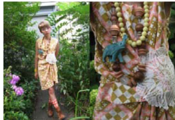
Image 8. First day of School. www.thestylerookie.com .