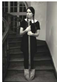
Image 11. Addams Girl. www.thecherryblossomgirl.com .