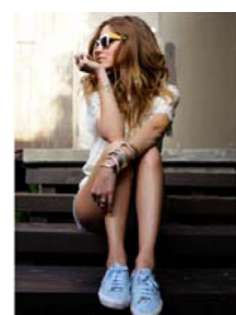
Image 16. Superga Collabo. www.theblondsalad.com