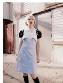
Image 15. MiuMiu Collabo. www.thestylerookie.com