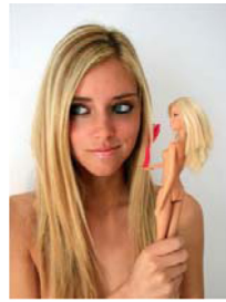
Image 3. Here I am. www.theblondsalad.com .