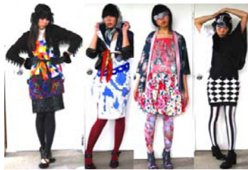
Image 7. Trying too hard. www.stylebubble.co.uk .