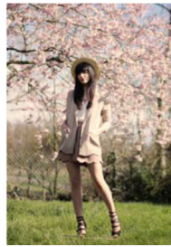
Image 2. Cherry blossom. www.thecherryblossomgirl.com .