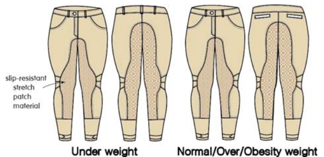
Fig. 3. Horse-riding pants design by BMI.