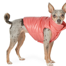
Fig. 24. Moncler Genius.