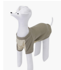
Fig. 5. PENNECT. www.kolonmall.com