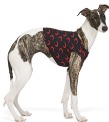
Fig. 23. Marine Serre. www.ssense.com