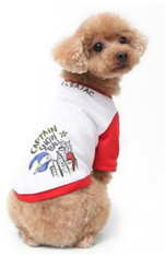
Fig. 3. CASTELBAJAC. www.mall.castelbajac.com