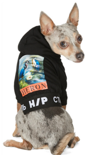
Fig. 21. Heron Preston. www.milanstyle.com