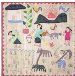
Fig. 2. Khatwa Work (“Development”, commissioner”, n. d.).

인도 서부지역의 대표적인 자수는 쿠치 자수(Kutch embroidery), 수랏 자리 자수(Surat Zari craft)가 있다. 쿠치자