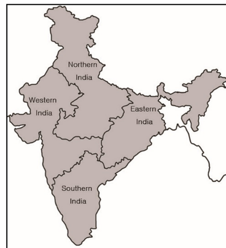
Fig. 1. Region of India. (Nag & Sengupta, 1992)

이처럼 인도의 지역은 다양한 기준을 기반으로 하여 구분할 수 있었고 본 연구에서는 인도의 지역을 인도 지리학 관련 선행연구(Nag & Sengupta, 1992)를 기반으로 하여 위의 언급한 언어권, 기후, 종교뿐만 아니라 문화, 예술, 역사 등을 종합하여 동부, 서부, 남부, 북부인도 4가지로 분류(Fig. 1)하였으며 이를 연구에 적용하였다.