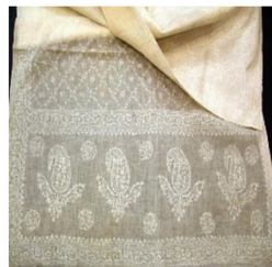
Fig. 13. Sari-chikan.