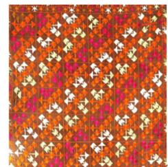
Fig. 15. Phulkari. artsandculture.google.com