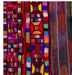
Fig. 9. Lambani embroidery. artsandculture.google.com