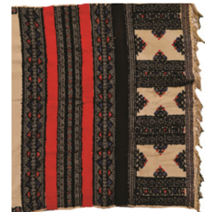
Fig. 10. Toda embroidery (Sharma & Bhagat, 2018).