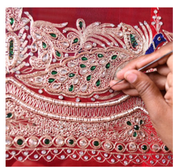
Fig. 7. Zari Zardozi.