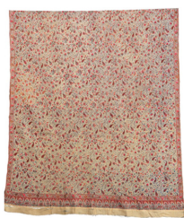
Fig. 12. Shawl