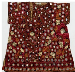
Fig. 6. Child's Dress. www.vam.ac.uk

남부 인도의 대표적인 자수는 카수티 자수(Kasuti embroidery), 산달 람바니 자수(Sandur lambani embroidery), 토다자수(Toda embroidery)가 있다. 먼저 카수티 자수(Fig. 8)는 손을 뜻하는 Kai와 면을 뜻하는 Suti의 합성어로 면사로 면 원단에 자수하는 기법을 의미한다. 이 자수법은 주로 인도여성의 전통의상인 사리의 장식에 많이 사용되는데 주로 어두운 색상의 원단에 대비되는 적색, 주홍색, 보라색, 녹색, 황색, 청색 등의 선명한 색상으로 자수한다. 주로 사용되는 문양은 사원의 형태나 황소, 코끼리 사슴 등의 동물 그리고 연꽃 등의 식물문양이 주로 사용되며 이들 문양은 모두 직선이나 각을 이루는 기하학적 문양으로 상징화된 것이 특징이다(Dhamija, 2004). 이러한 문양을 자수하기 위해서는 바느질 방법이 중요한데, 카수티 자수의 단 순하지만 정교한 스티치는 4가지로 설명될 수 있다. 러닝 스티치로 시작해서 처음 바느질을 시작한 곳으로 돌아가 원단의 앞, 뒷면 모두에 같은 문양을 표현하는 가반티(Gavanti), 계단의 형태처럼 보이게 자수하는 무르기(Murgi), 다닝 스티치로 알려진 직선으로 면을 채우며 문양을 표현하는 네기(Negi), 그리고 흔히 십자수로 일컫는 십자 모양으로 수놓는 크로스 스티치(cross-stitch)와 동일한 바느질 법인 멘티(Menthi)로 대표된다(Crill, 1999). 산달 람바니 자수(Fig. 9)는 14세기경 중앙 아시아에서 현재의 카르나타카 지역으로 이주해온 유목민들의 전통 자수로 여성들의 의상을 화려하게 꾸미기 위해 주로 사용되었던 자수이다. 주로 붉은색 면 원단에 주황색, 녹색, 황색, 청색 등의 선명한 색의 면사를 주로 이용하며 주로 사용되는 문양의 경우 삼각형, 사각형, 직선 등의 기하학적 무늬를 사용한다. 또한 람바니 자수는 다양한 장식물을 함께 달아 의상을 장식하는데 인도에서 많이 사용되는 거울은 물론이고 조개 껍데기나 구멍을 뚫은 동전을 사용하기도 한다. 현재는 의복뿐 만 아니라 벽장식 등의 실내 인테리어나 침구류, 가방 등에 주로 사용된다(“Lambani Embroidery”, n. d.). 마지막으로 토다 자수(Fig. 10)는 흰색 면 원단에 적색과 흑색의 두가지 색상의 자수사만을 사용해 자수하는 전통자수 기법이다. 촘촘하게 자수하기 때