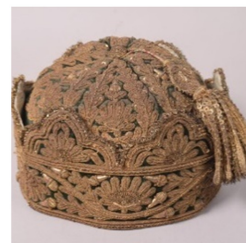
Fig. 14. Cap (headgear). www.vam.ac.uk