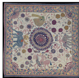
Fig. 4. Kantha coverlet.