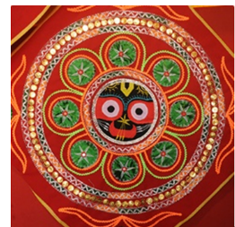
Fig. 5. Pipli. www.odishatourism.gov.in