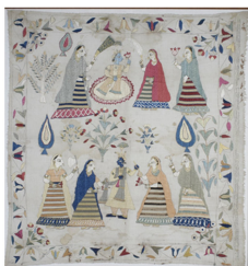
Fig. 11. Chamba Rumal with Scenes of Gopis Adoring Krishna. artsandculture.google.com

법의 경우는 앞, 뒷면이 동일하게 나타나는 더블 새틴 스티치가 주로 사용된다. 참바 루말 자수의 경우 용도는 의복보다는 종교의식이나 결혼식 등의 장식물로 주로 사용된다(Naik, 1996). 카슈미르 지역의 수자니 자수(Fig. 12)는 페르시아어로 자수를 뜻하는 말이며 주로 염소의 털로 만든 파시미나(pashmina)에 실크나 울 자수사를 이용한 자수법을 의미하는 것으로 아주 섬세하고 작은 문양을 이용하여 원단을 장식한다(Development commissioner(handicraft)-Ministry of Textiles, Government of India, n. d.). 주로 사용되는 문양으로는 기하학적 디자인과 양식화된 꽃과 식물 그리고 인도에서 부타(Buta)라고 불리는 페이즐리 패턴으로 크기가 작고 반복되는 문양을 사용하는 것이 특징이다(“Shawl”, n. d.). 색상의 경우 자수사는 빨간색, 분홍색, 파란색, 노란색, 녹색, 갈색 등의 선명한 색을 다양하게 이용하며 원단의 경우 흰색이나 크림색이 주로 사용되지만 현대에 들어서 검은색이나 남색, 적갈색 등의 어두운 색조로 염색한 원단을 사용하기도 한다. 스티치는 주로 러닝 스티치가 사용되지만 테두리 작업을 위해 스템(Stem) 스티치를 사용하기도 하며 새틴 스티치, 체인 스티치 등 다양한 스티치가 사용된다. 수자니 자수의 용도로는 주로 솔 등의 여성 의상에 가장 많이 사용되며 침구류나 실내 장식에도 많이 사용된다(Naik, 1996). 럭나우 지방의 치칸커리(Fig. 13)는 때때로 쉬폰 등의 실크 소재의 원단이 사용되기도 하지만 보통 흰 모슬린 천에 흰색 면 자수사를 이용해서 자수하는 것으로 레이스와 같은 효과를 주며 화이트 워크(white work)라고 불리기도 한다(“Sari-chikan”, n. d.). 터키 자수에서 유래한 것으로 추정하고 있으나 사용되는 문양의 경우 터키 자수와는 상이하며 인도 지역 고유의 문양을 발전시킨 것으로 보인다. 치칸커리에 사용되는 문양의 경우, 디자인은 주로 꽃문양이 사용되며 기하학적 문양이나 페이즐리 문양 역시 사용된다. 용도는 주로 블라우스 등의 의류나 손수건, 모자, 테이블 보 등으로 주로 쓰인다(Naik, 1996). 자르도지(Fig. 14) 페르시아어로 금색 자수를 의미하는 것으로 앞서 언급한 자리 자수와 동일하게 사용되는 단어로 금속사를 이용한 자수를 의미한다(Bhandari, 2015). 자르도지 역시 금속사와 함께 진주, 스팅글, 보석류를 함께 자수에 사용하기도 하며 꽃, 식물, 아몬드 모양의 페이즐리 문양을 주로 사