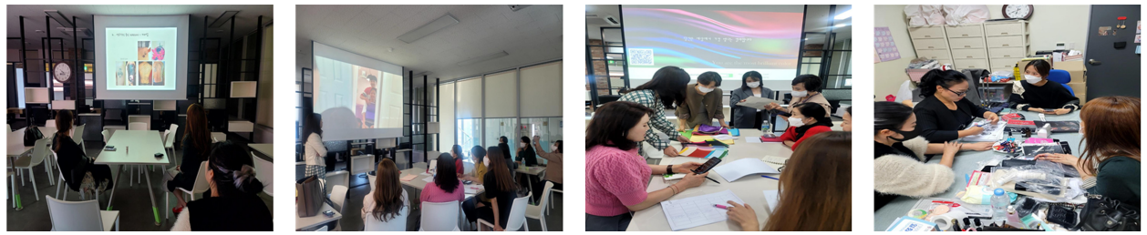
Table 15. Class preparation images of instructors

루하지 않은 수업진행, 전문적인 교안이 주된 요인이었음에도 불구하고, 교구 설계에 있어서는 다소 미비한 점도 도출되었다고 하였다. 미용 전문용품으로 교구 구성을 위해 많은 비용과 공을 들였으나, 파손이나 분실의 가능성이 있는 학교현장에서 사용이 부담스러워 체험 활동에 오히려 제약이 되는 경우도 있었다고 하였다.