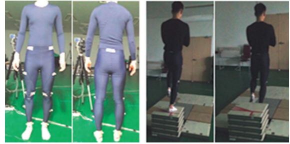
Fig. 2. Single-leg drop landing from 40cm height with three trials. (Lee et al., 2016)

부분 효과 중 각속도는 가압 수준이 중간인 컴프레션웨어에서 착지 시 엉덩관절과 무릎관절에서 통계적으로 유의하게 큰 효과를 확인하였다. 가동 범위 역시, 가압 수준이 중간인 컴프레션웨어가 엉덩관절에서 가장 컸다. 반면, 흔들림은 x, y, z 위치 변위의 차이값(최대값-최소값)으로 정의하고, 허벅지 중양과 무릎 외측에서 공중 구간과 착지 구간으로 나누어 분석하였는데, 컴프레션웨어에 따른 유의차가 없었다. 전체 효과는 지면반력 중 수직 힘(peak vertical ground reaction force; Peak_GRE)과 무릎 피크 모멘트(knee joint peak moment; Peak_Moment)로